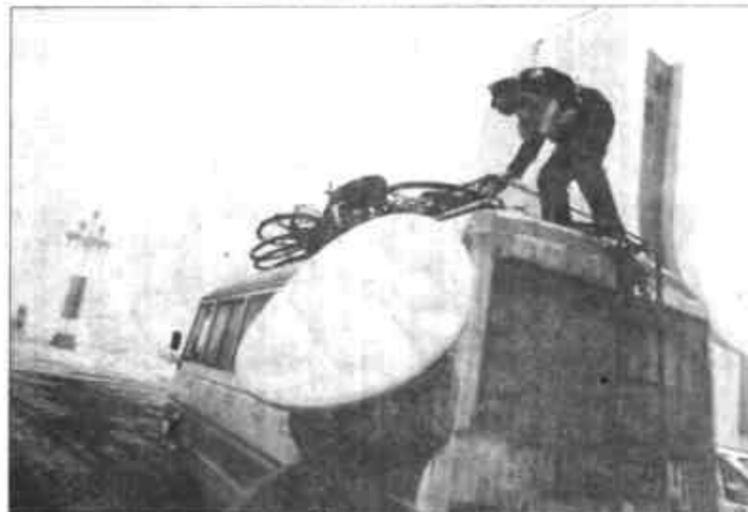
对违章车辆及时处理,保障行驶安全