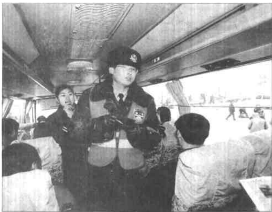
交警清点每辆客车乘员,严禁超员载客。