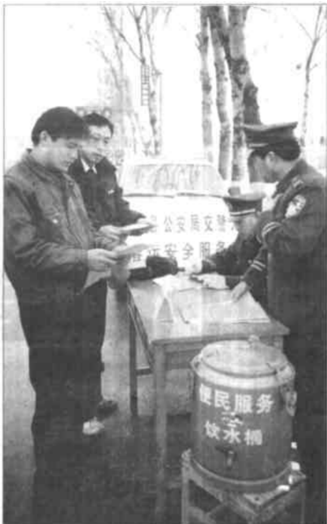
广饶县交警大队在道路站点设立春运便民服务站。