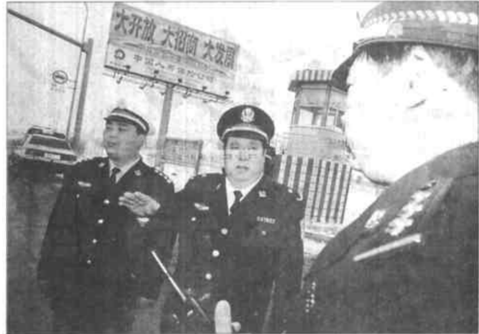
雪天路滑,市公安局和交警支队领导到各岗亭进行巡查。