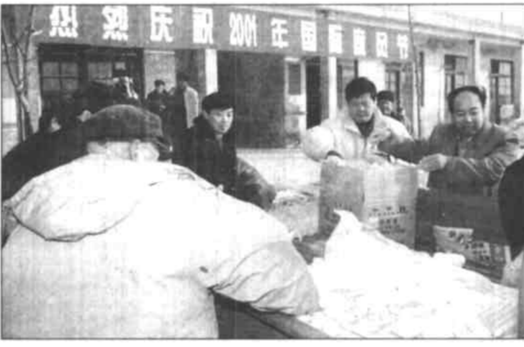
在国际麻风节和春节到来前夕，市和广饶县卫生局的负责同志带着党和政府的关怀，前去慰问这些麻风病人，在寒冷的冬天为他们带来了春天般的温暖。